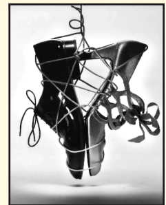
LE BAL MODERNE

Accès culture : communication@accessculture.org